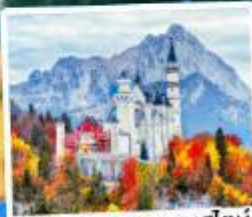
ปราสาทน้อยชวานสไตน์