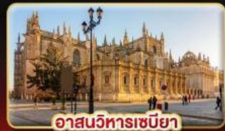
อาสนวิหารเซบิยา