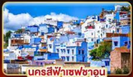
นครสีฟ้าเชฟชาอูน

📅 เดินทาง: 18-27 ต.ค. | 02-11 ส.ค. 69 27 ส.ค. 69 - 05 ม.ค. 70