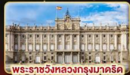
พระราชวังหลวงกรุงมาดริด