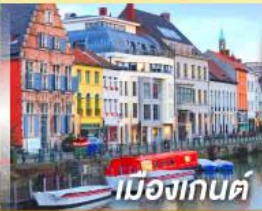
เมืองกันต์