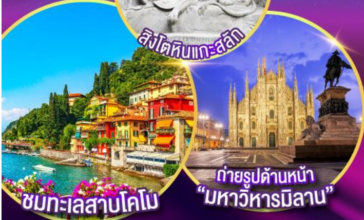
ชมทะเลสาบโคโม