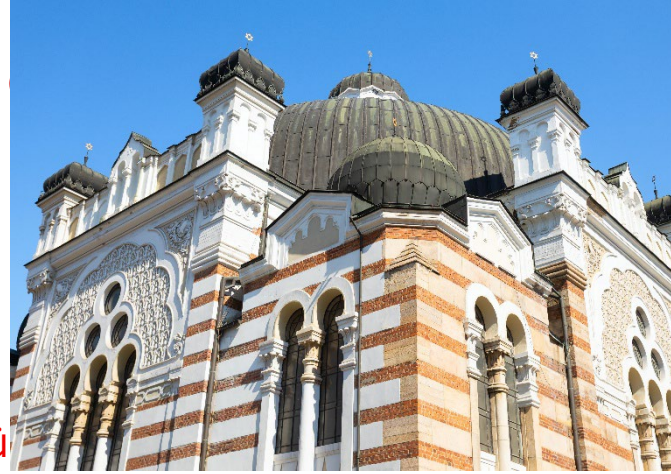
Royal Palace of Sofia