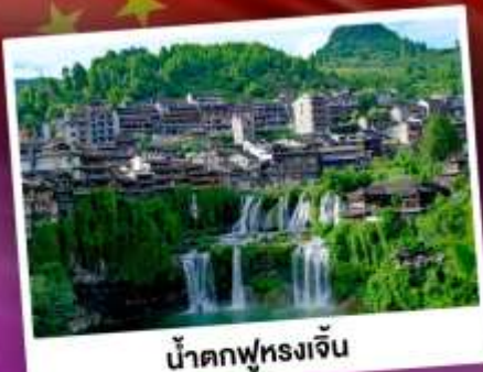
น้ำตกฟูหรงเจิน

เที่ยวชมหมู่บ้านโบราณริมน้ำตก "ฟูเอรงเจิน" นั่งกระเช้าขึ้นสู่อุทยาน กูเขาเจ็ดดาว