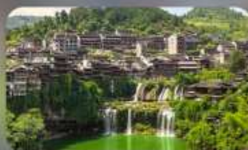
หมู่บ้านโบราณฟุทงเจิน