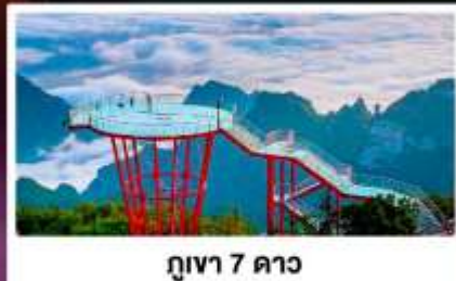
กูเขา 7 ดาว