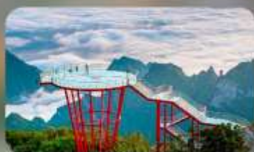
ภูเขา 7 ดาว