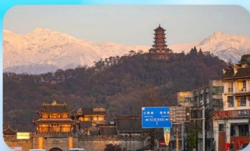
เมืองโบราณกวนเสี้ยน