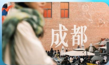
ดงเจียวจี้