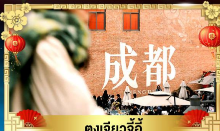
ตงเจียวจี้

เทือกเขาแอลป์แห่งเมืองจีน ชมความงามของ "อุทยานภูเขาสี่ดรุณี"