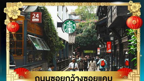
ถนนชอยกวางชอยแคบ