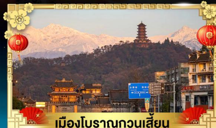
เมืองโบราณกวนเสียน