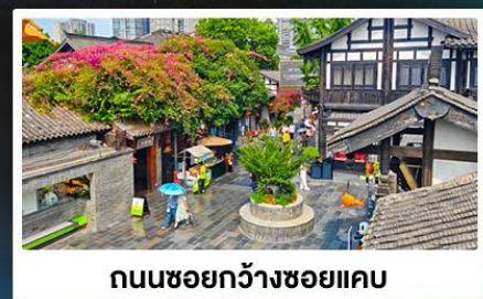
ถนนชอยกวางชอยแคว