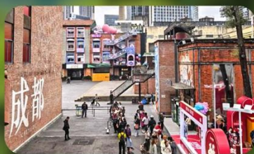
ตงเจียวจ้ออ๋อ