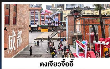
ตงเจียวจ้ออี้