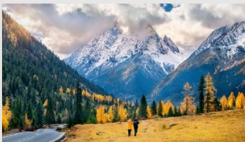
ภูเขาสี่ดรุณี (หุบเขาชวงเจียวโกว)