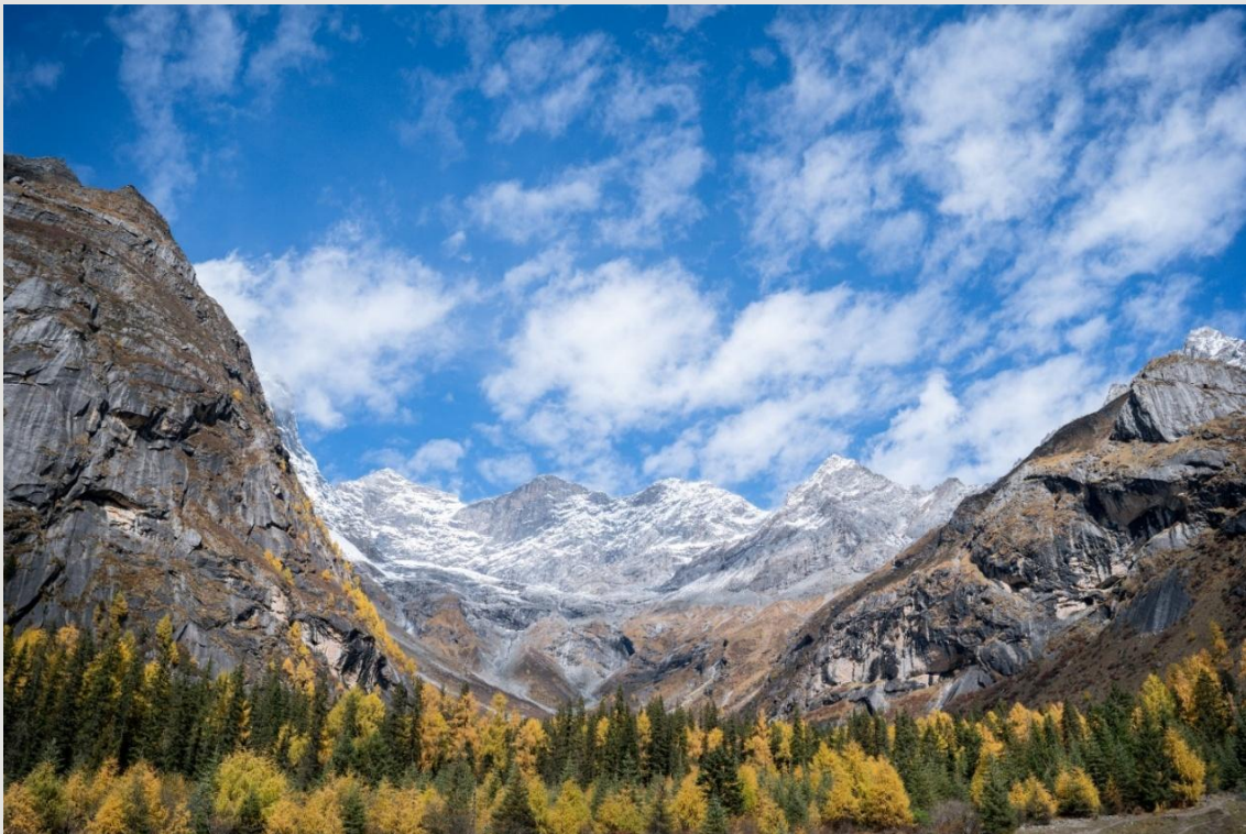
ฤดูใบไม้ร่วง (AUTUMN)