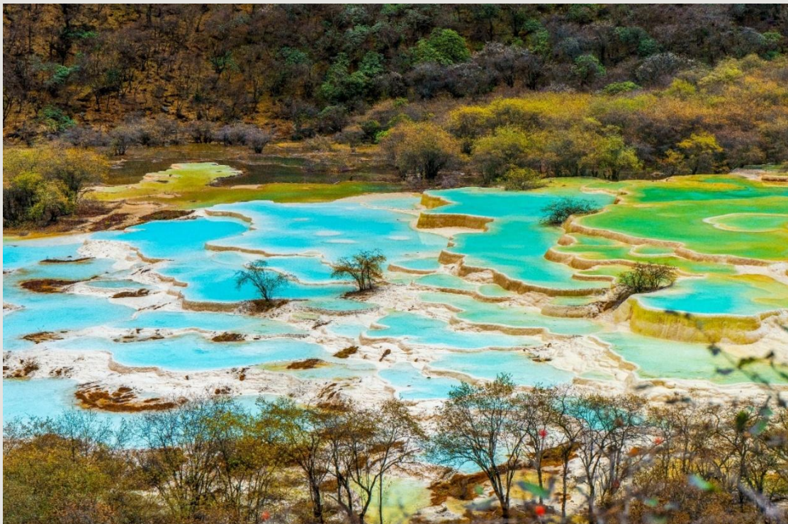
ฤดูใบไม้ร่วง (AUTUMN)