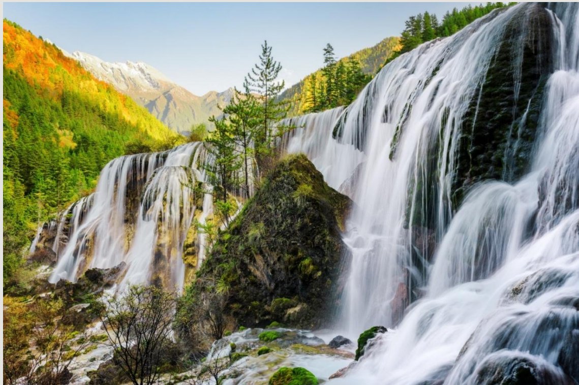
ฤดูใบไม้ร่วง (AUTUMN)