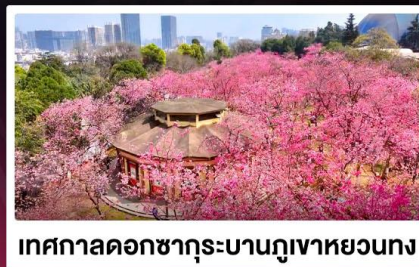
เทศกาลดอกซากุระบานกุเอาหยวนทง