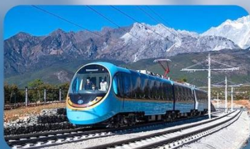
นั่งรถไฟชมกุเจาหิมะมังกรหยก