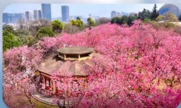
เทศกาลดอกซากุระบานกุเจาหยวนทง