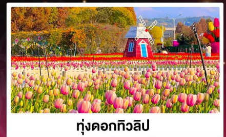
ทุ่งดอกทิวลิป