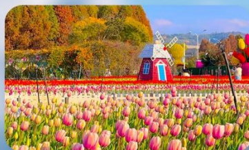
ทุ่งดอกทิวลิป