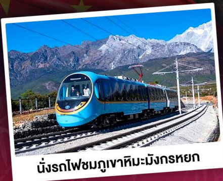
นั่งรถไฟชมกุเอาเจี๋ยมั่งกรดยก