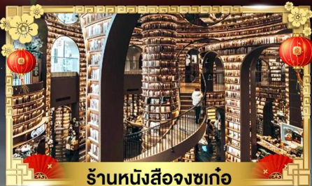
ร้านหนังสือจงซูเก๋อ