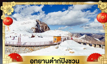
อุทยานต้ากู่ปิงชวน