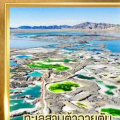
ทะเลสาบต้าฉายตั้น