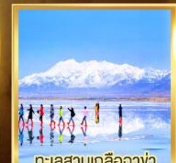
ทะเลสาบเกลืออฉางฟา