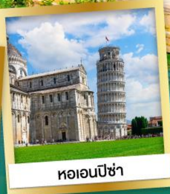
หอเอนปิซ่า