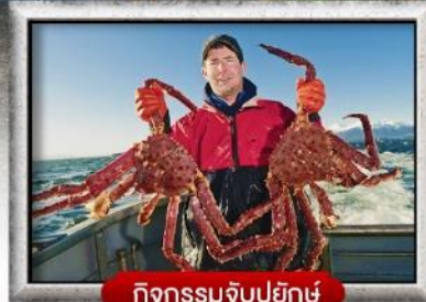
กิจกรรมจับปูยักษ์