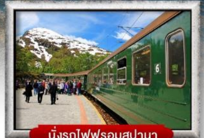
นั่งรถไฟพร้อมสปรานา

พิเศษ! พักบนเรือสำราญ แบบ Window Room 2 คืน, พักบ้านแซนต้าคลอส