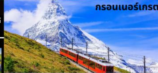
กรอนเนอร์เกรต