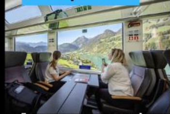
รถไฟ Panarama วิวดูทิวทัศน์