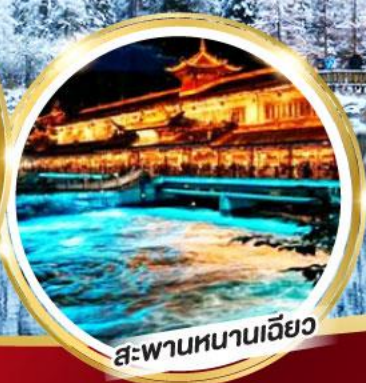
สะพานหนานเฉียว