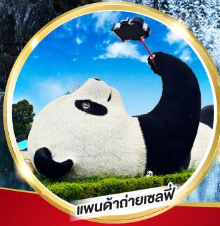
แพนด้ายักษ์