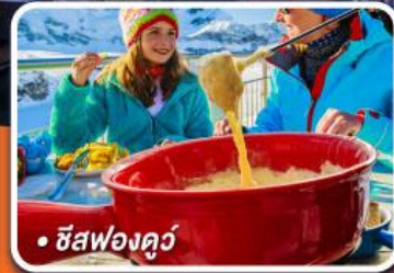
• ชีสฟองดูว์

เที่ยวครบ 5 เมืองสวยแคว้นอัลซาส สตราสบูร์ก ริคเวียร์, กอลมาร์, เอทีเซมและริเบอร์วิลล์