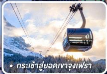
• กระเช้าสูยยอดเขาจุงเฟรา