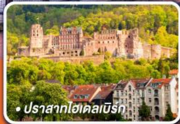
• ปราสาทไคเคิลเบิร์ก