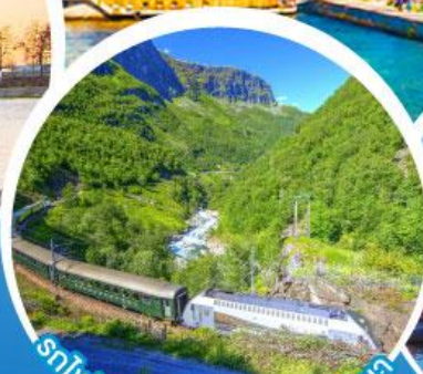
รถไฟสายโรแมนติกฟลัมสบานา