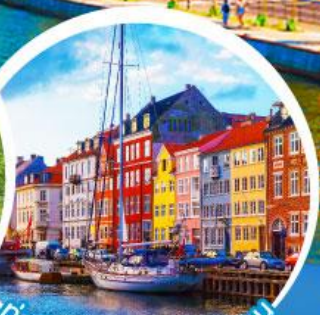
ท่าเรือฮาวน์.โคเปนเฮเกน

เดินทาง 18-27 มี.ค. 68 10-19, 11-20 เม.ย. 68 02-11, 16-25 พ.ค. 68