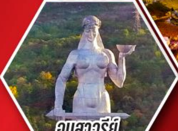
อนสาวรีย์