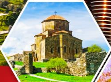
วิหารจวารี