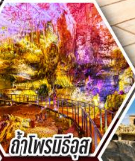
ด้าไฟรมีร์ฮูล