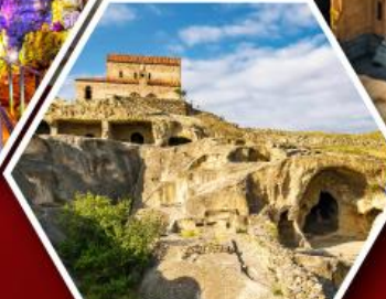
เมืองด้าอพลิสต์ซิคเคห์