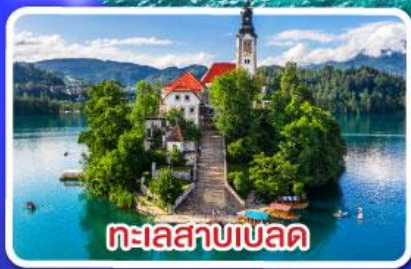
ทะเลสาบเบลลด

ไข่มุกแห่งอาเดรียติก พร้อมขึ้นกระเช้า SRD