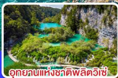
อุทยานแห่งชาติพลิตวิเช่