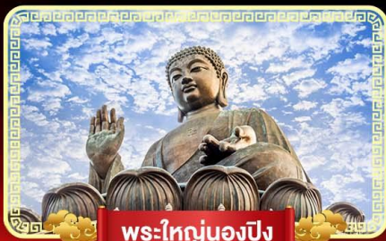
พระใหญ่ทองปิง

ฟรีเปิดท้องพระคลังเจ้าแม่กวนอิม บินลัดฟ้าไปมูสู่เกาะฮ่องกง