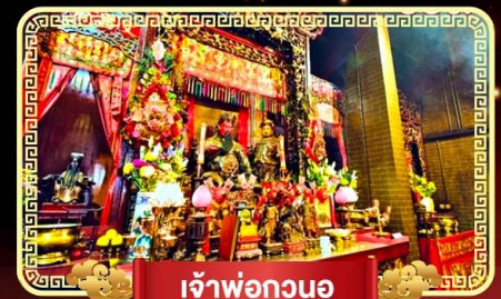
เจ้าพ่อกวนอู