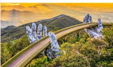
บานาฮิลล์