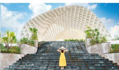
สวนเอเปค