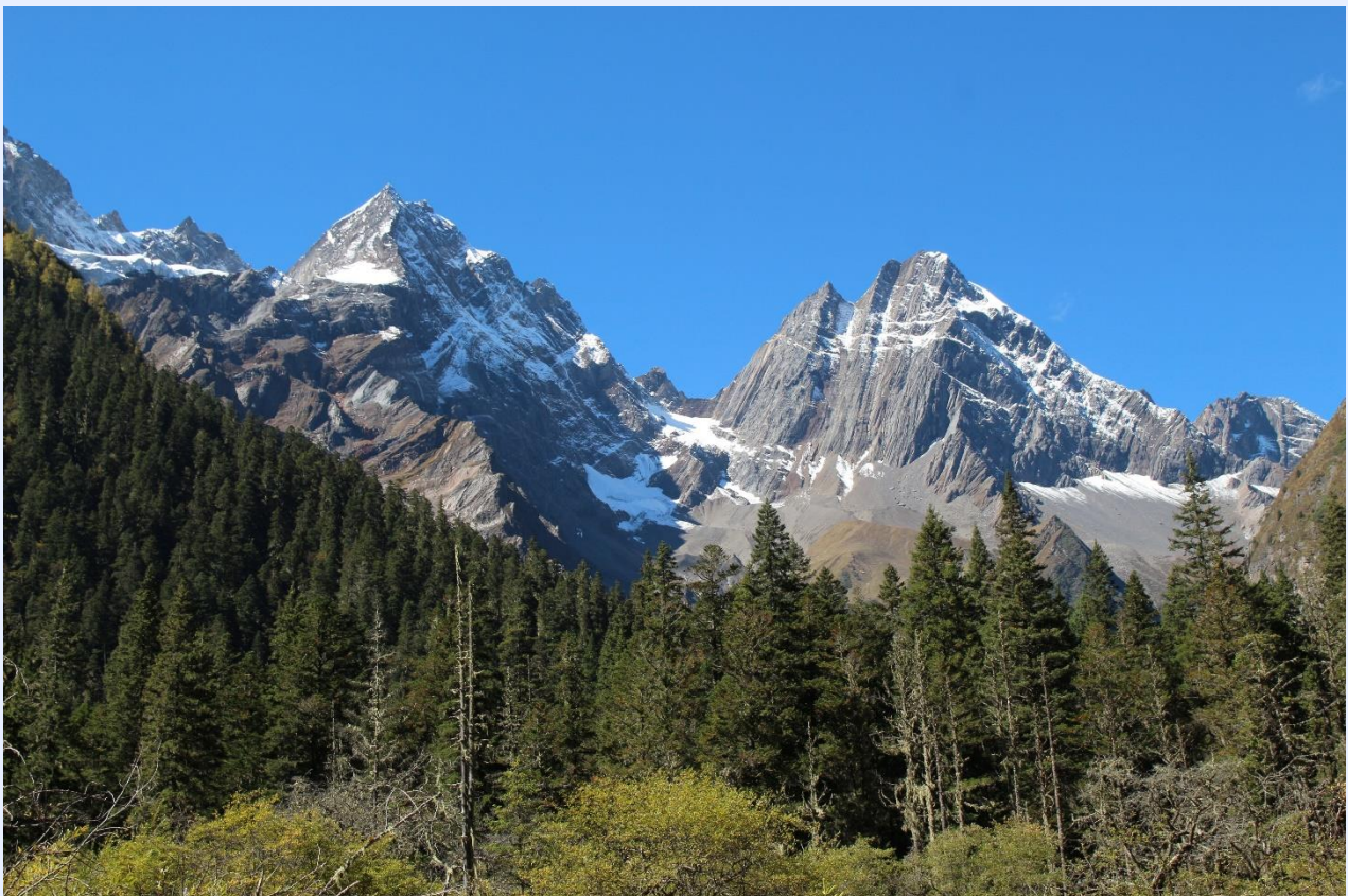
ฤดูใบไม้ผลิ (SPRING)