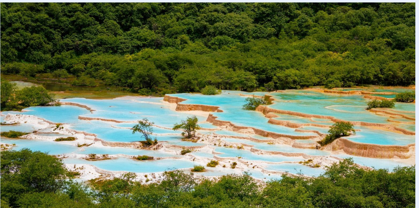
ฤดูใบไม้ผลิ (SPRING)