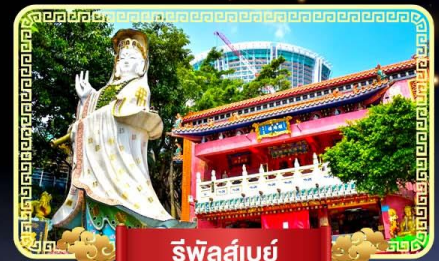
จีฟัลส์เบย์