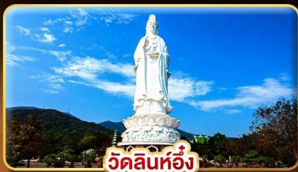
วัดลินห์อิ่ง