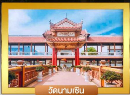
วัดนามเซิน