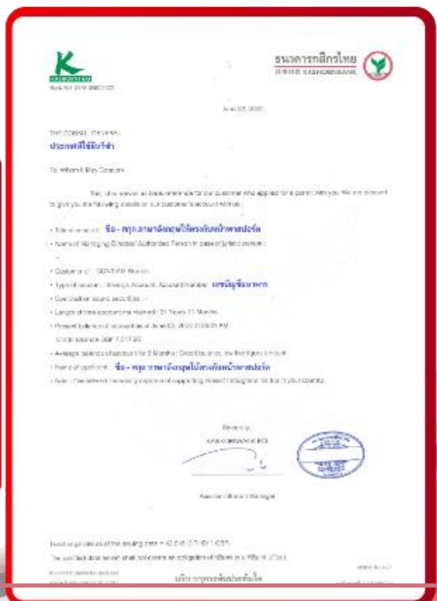
ตัวอย่าง Bank Guarantee ที่ผู้สมัครต้องขอกับธนาคาร