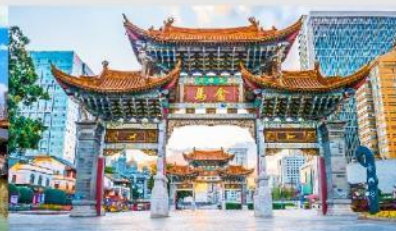
ประตูม้าทอง ไถ่หยก

*ทางบริษัทฯ ขอสงวนสิทธิ์ในการสลับโปรแกรมทัวร์ตามความเหมาะสมขึ้นอยู่กับสถานการณ์หน้างาน โดยคำนึงถึงผลประโยชน์ของลูกค้าเป็นสำคัญ