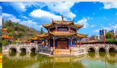
วัดหยวนทง