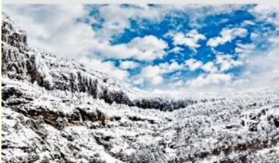
ภูเขาหิมะเจียวจื่อ