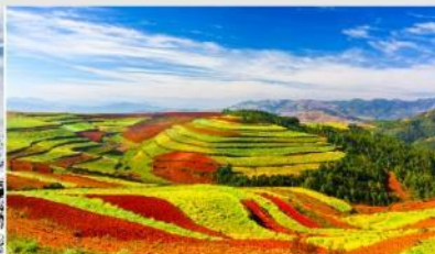
แผ่นดินสีแดง