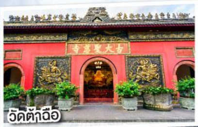
วัดต้าอ้อ