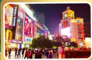
ช้อปปิ้งถนนชุนชิว