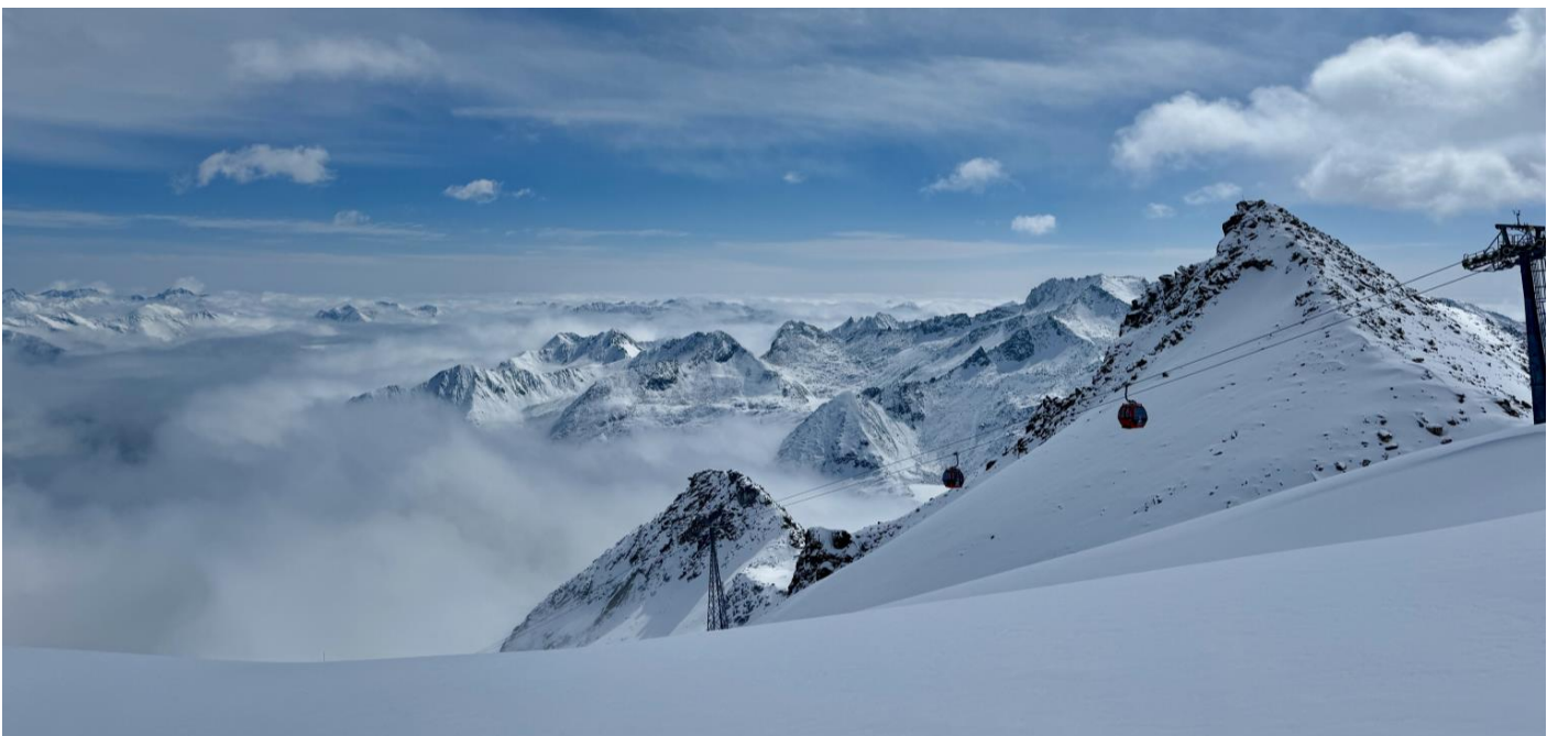
GO1TFU-TG011 เฉิงตู ภูเขาหิมะกลาเซียร์ต้ากู่ปังชวอน โหมวหนี่โกว จิวจ้ายโกว(นั่งรถไฟความเร็วสูง) 6วัน 5คืน *ไม่ลงร้านช้อปปิ้ง/รวมรถเหมา* โดยสายการบิน Thai Airway (TG)