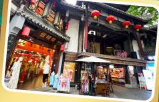
ถนนโบราณจีนหลี