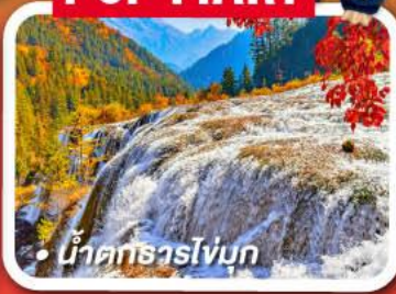
น้ำตกธารไร่มุก