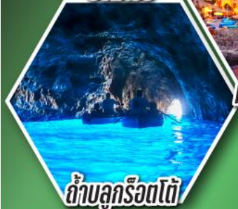
ถ้ำลูกรोटโต้