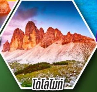
โตโลไมท์

โปรแกรมเดี่ยว เก็บครบรอบ อิตาลี ตั้งแต่เหนือถึงใต้