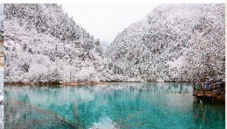
อุทยานแห่งชาติจิวจ้ายโกว