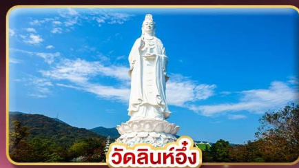
วัดลินห์ฮ้าง