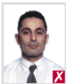
ไกลเกินไป