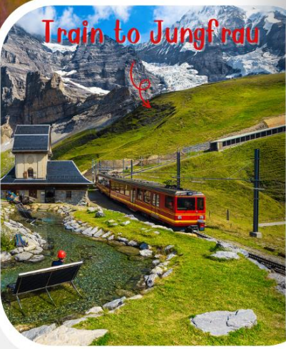
Train to Jungfrau