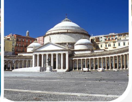
Piazza del Plebiscito