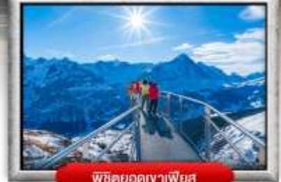
พิชิตยอดเขาพียส