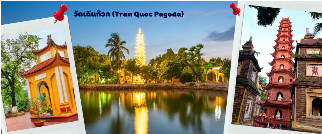
วัดเจ็นกิวก (Tran Quoc Pagoda)

ผังเป็นอย่างดี ใช้สีสันทึกลมกลืนในโทนสีเหลือง น้ำตาล ตัดกับสีเขียวของต้นไม้ใหญ่ที่โอบล้อมอยู่ในมุมถ่ายภาพจากอีกฝั่งหนึ่ง จะเห็นสิ่งปลูกสร้างสไตล์จีน และเจดีย์หลายชั้นโดดเด่น มีภาพที่สะท้อนลงสู่ผืนน้ำ เป็นภูมิทัศน์ที่งดงามทั้งยามกลางวันและยามค่ำคืนที่มีการเปิดไฟส่องสว่าง