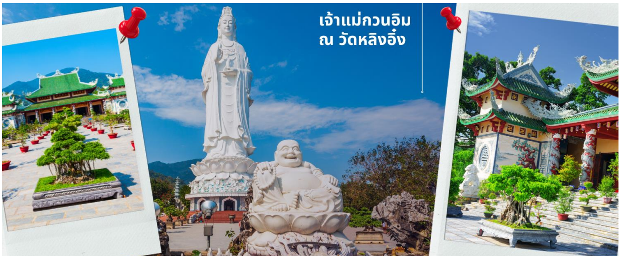
เจ้าแม่กวนอิม ณ วัดหลิงอิ่ง

นำท่านมัศจรรย์องค์ เจ้าแม่กวนอิม ณ วัดหลิงอิ่ง อยู่บนเกาะเซินตรา (Son Tra) ทางเหนือของเมืองดานัง เป็นวัดใหญ่ที่สุดของที่นี่ รูปปั้นปูนขาวของเจ้าแม่กวนอิมยืนหันหลังให้ภูเขา หันหน้าออกสู่ทะเลเพื่อเป็นการปกป้องคุ้มครองชาวประมงที่ออกไปหาปลา เสียงระฆังวัดที่ดีประสานกับเสียงคลื่นนั้นช่วยให้ชาวเรือรู้สึกสงบ