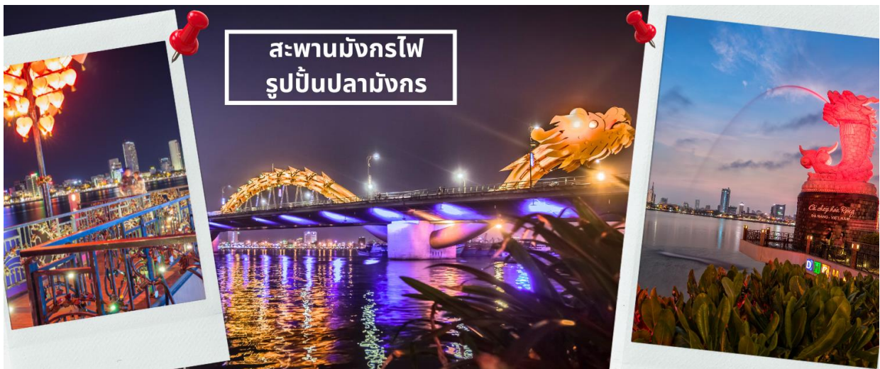
สะพานมังกรไฟ รูปปั้นปลามังกร

จากนั้นนำท่านชม สะพานแห่งความรัก ที่นิยมของหนุ่มสาวคู่รักกันมาซื้อกุญแจใส่คล้องใส่สะพาน จากนั้นนำท่านชม รูปปั้นปลามังกร ที่เป็นสัญลักษณ์ของเมืองดานัง เมืองที่กำลังจะกลายเป็นมังกรในระยะใกล้แห่งเอเชียตะวันออกเฉียงใต้ เชิญท่านเพลิดเพลินกับความอลังการของ สะพานมังกรไฟ ที่มีความยาวถึง 666 เมตร เป็นสะพาน 6 เลนส์ ซึ่งเป็นสะพานที่ตระการตามากที่สุดของเวียดนามในเวลานี้โดยการแสดงนี้จะเริ่มเวลา 21.00 น. ของวันเสาร์และอาทิตย์เท่านั้น