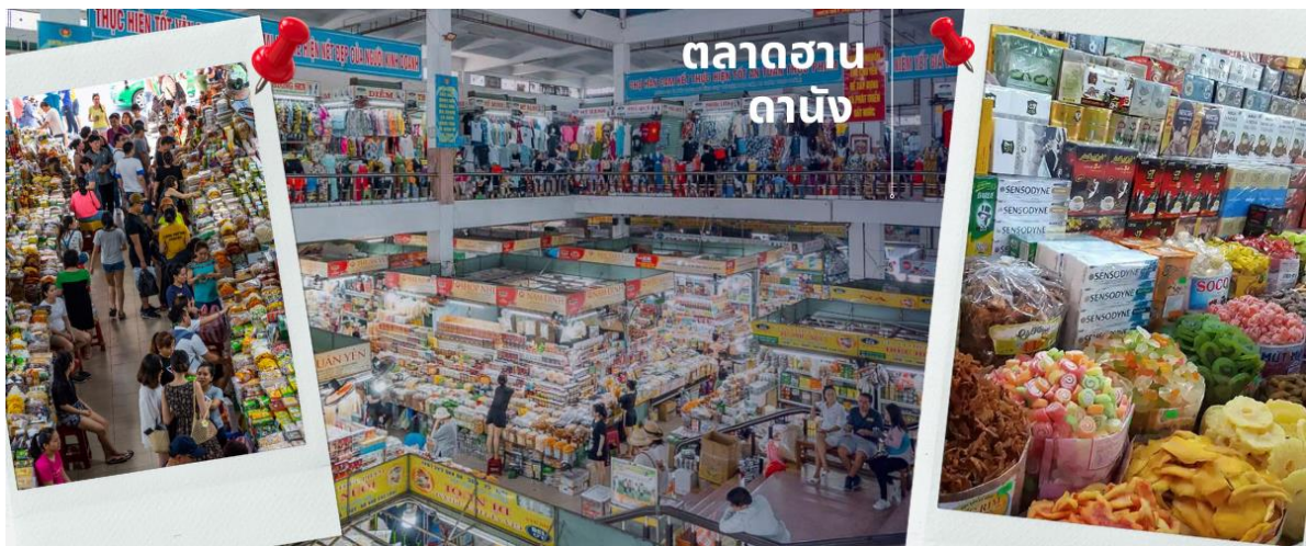
ตลาดฮาน ดานัง

นำท่านไปละลายทรัพย์ที่ ตลาดฮาน เป็นตลาดที่รวบรวมสินค้ามากมายเป็นที่นิยมทั้งชาวเวียดนามและชาวไทย อาทิ เสื้อเวียดนาม หมวก รองเท้า กระเป๋า สินค้าพื้นเมือง โดยเฉพาะงานฝีมือ อาทิ ภาพผ้าปัก มืออ่อนวิจิตร โคมไฟ ผ้าปัก กระเป๋าปัก ตะเกียบไม้แกะสลัก ชุดอ่าวหย่าย (ชุดประจำชาติเวียดนาม) ฯลฯ ไว้เป็นที่ระลึกมากมายเพื่อฝากคนที่บ้าน