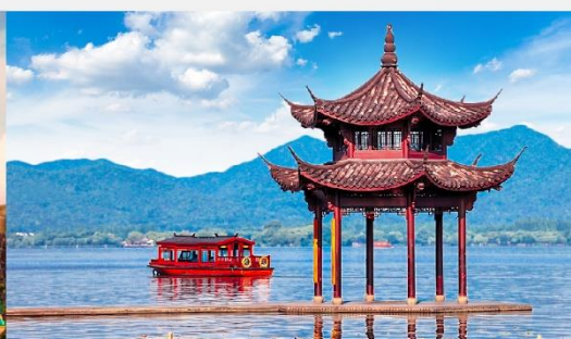
ล่องเรือชมทะเลสาบซีหู