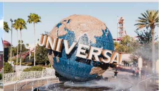
ยูนิเวอร์เซล ปักกิ่ง รีสอร์ท