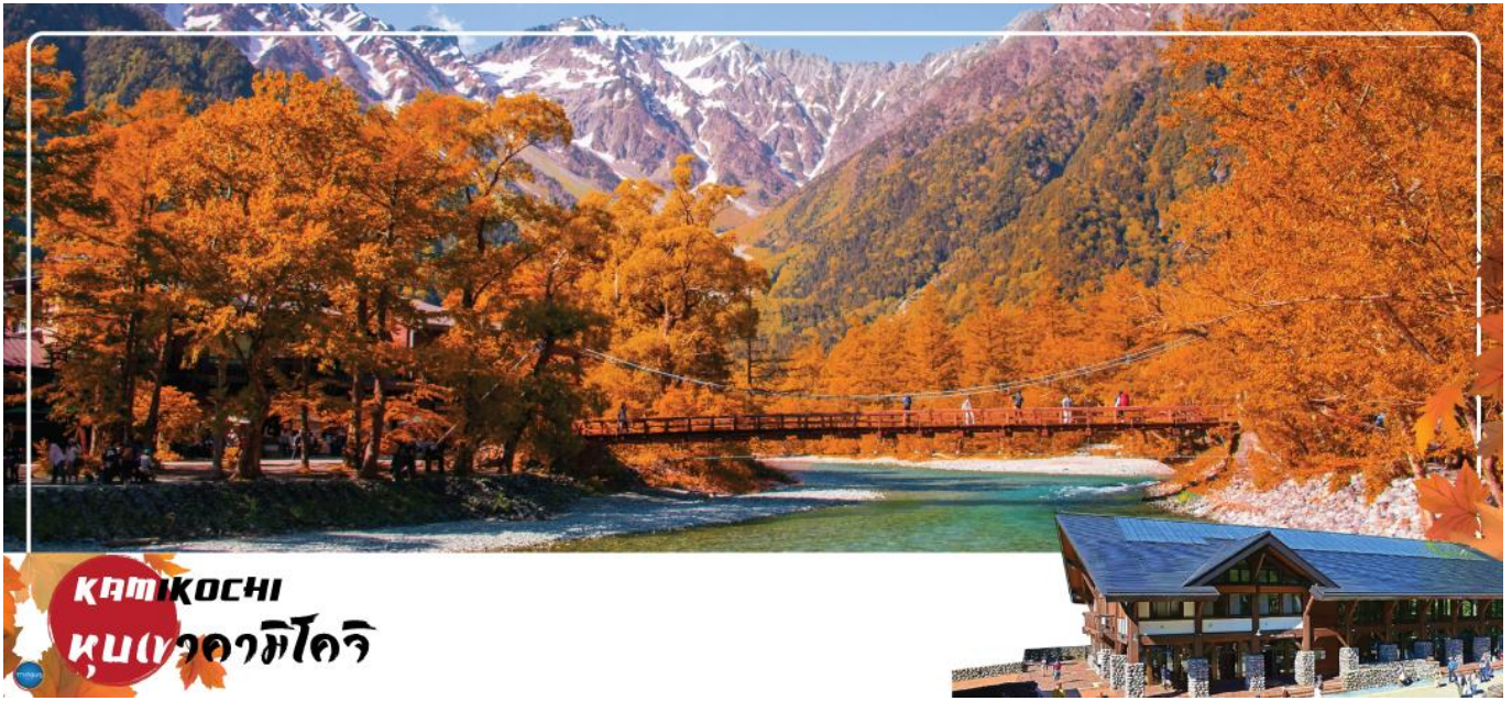
KAMIKOCHI หุบเขาอาชิโงริ

จากนั้นนำท่านเดินทางสู่ คามิโคจิ (Kamikochi) (ใช้เวลาเดินทางประมาณ 50 นาที) แหล่งท่องเที่ยวทางธรรมชาติที่มีทิวทัศน์ภูเขาที่สวยงามที่สุดแห่งหนึ่งของประเทศญี่ปุ่น ดินแดนแห่งธรรมชาติท่ามกลางหุบเขาแสนสวยของเทือกเขา "เจแปน แอลป์" (Japan Alps) เป็นหุบเขาในฝันที่อยู่สูงขึ้นไปทางเหนือของเทือกเขาแอลป์ญี่ปุ่น ภาพสายน้ำของแม่น้ำอะซุสะ ที่ใสสะอาดไหลผ่านสะพานคัปปะ ล้อมรอบด้วยต้นป่าเขียวขจี และฉากหลังของยอดเขาสูงตระหง่านระดับ 3,000 เมตรให้ท่านได้เพลิดเพลินกับการเดินเล่นสบายๆ ไปกับธรรมชาติที่สวยงาม อิสระให้ท่านได้เก็บภาพความประทับใจตามอัธยาศัย สะพานคัปปะ-บะชิ เป็นจุดที่มีคนเยอะที่สุดในคะมิโคจิ และในบางครั้งก็ให้ความรู้สึกเหมือนทางแยกที่มีชื่อเสียงของชิบูยะ มีผู้คนมากมายเดินข้ามไปข้ามมาอยู่ไม่หยุดหย่อน มาถ่ายรูปใกล้กับสะพานหรือบนสะพาน นำท่านเดินทางสู่ เมืองมัตสึโมโตะ (Matsumoto) เป็นเมืองที่ใหญ่เป็นอันดับสองของจังหวัดนากาโนะ (ใช้เวลาเดินทางประมาณ 1 ชั่วโมง)