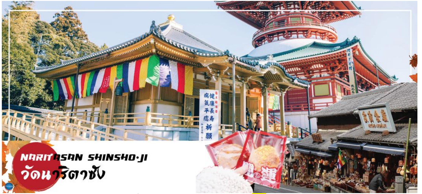
NARITASAN SHINSHO-JI วัดนาริตะชิน

วันที่หก เมืองนาริตะ – วัดนาริตะชิน – ถนนโอมโตะซังโตะ – ย่านโอไดบะ – ห้างไดเวอร์ซิตี – ท่าอากาศยานนานาชาตินาริตะ – ท่าอากาศยานสุวรรณภูมิ