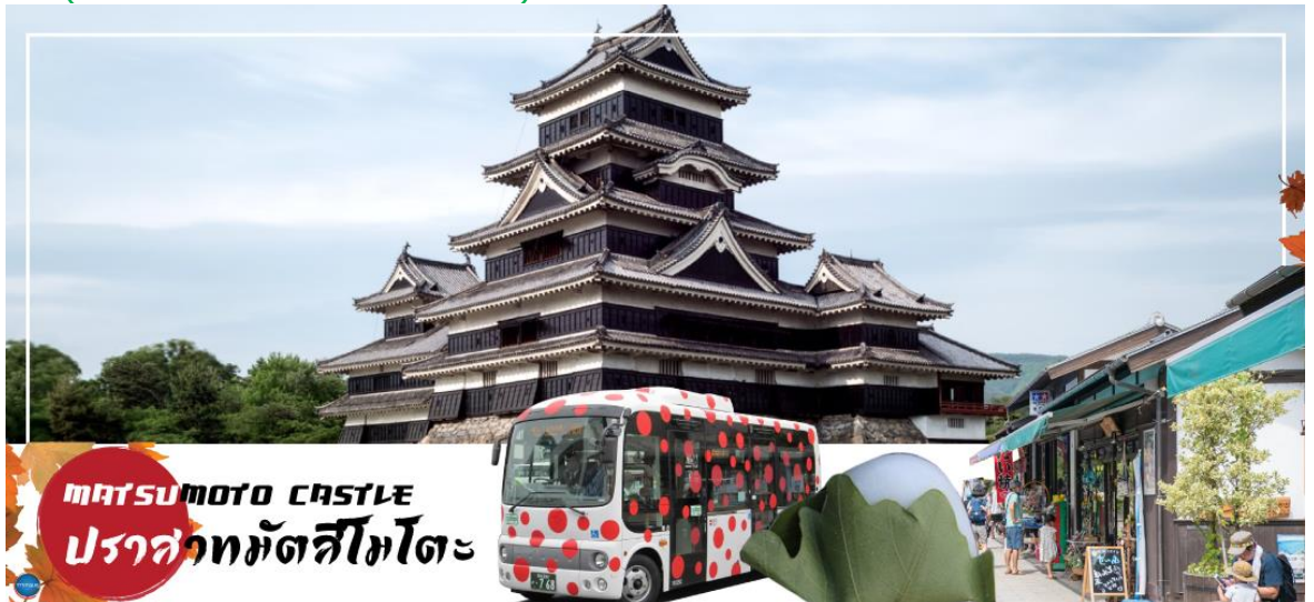
MATSUMOTO CASTLE ปราสาทมัตสึโมโตะ

จากนั้นนำท่านเดินทางสู่ คามิโคจิ (Kamikochi) (ใช้เวลาเดินทางประมาณ 50 นาที) แหล่งท่องเที่ยวทางธรรมชาติที่มีทิวทัศน์ภูเขาที่สวยงามที่สุดแห่งหนึ่งของประเทศญี่ปุ่น ดินแดนแห่งธรรมชาติท่ามกลางหุบเขาแสนสวยของเทือกเขา "เจแปน แอลป์" (Japan Alps) เป็นหุบเขาในฝันที่อยู่สูงขึ้นไปทางเหนือของเทือกเขาแอลป์ญี่ปุ่น ภาพสายน้ำของแม่น้ำอะซุสะ ที่ใสสะอาดไหลผ่านสะพานคัปปะ ล้อมรอบด้วยต้นป่าเขียวขจี และฉากหลังของยอดเขาสูงตระหง่านระดับ 3,000 เมตรให้ท่านได้เพลิดเพลินกับการเดินเล่นสบายๆ ไปกับธรรมชาติที่สวยงาม อิสระให้ท่านได้เก็บภาพความประทับใจตามอัธยาศัย สะพานคัปปะ-บะชิ เป็นจุดที่มีคนเยอะที่สุดในคะมิโคจิ และในบางครั้งก็ให้ความรู้สึกเหมือนทางแยกที่มีชื่อเสียงของชิบูยะ มีผู้คนมากมายเดินข้ามไปข้ามมาอยู่ไม่หยุดหย่อน มาถ่ายรูปใกล้กับสะพานหรือบนสะพาน นำท่านเดินทางสู่ เมืองมัตสึโมโตะ (Matsumoto) เป็นเมืองที่ใหญ่เป็นอันดับสองของจังหวัดนากาโนะ (ใช้เวลาเดินทางประมาณ 1 ชั่วโมง)