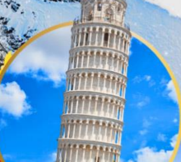
หออนปีซ่า