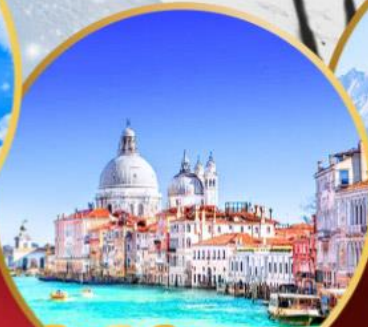
ล่องเรือสู่เกาะเวนิส