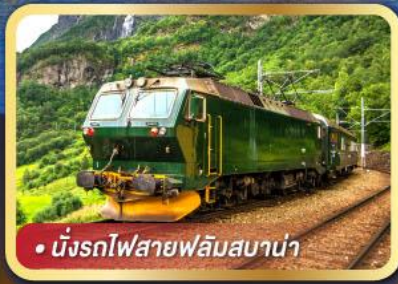
• นั้งรถไฟสายฟลั่มสบาน่า