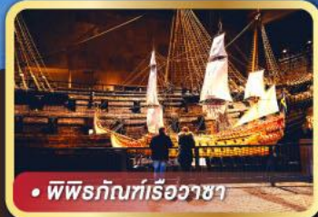
• พิพิธภัณฑที่เรือวาซา