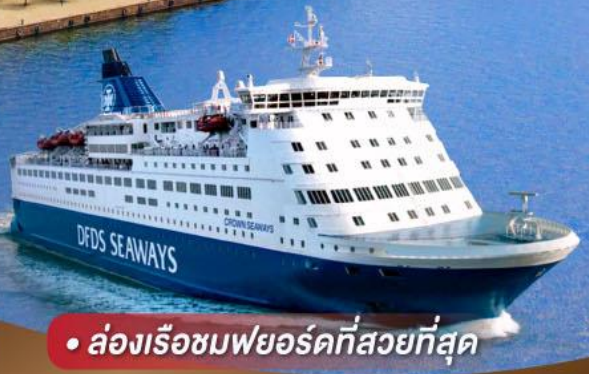
• ล่องเรือชมพยอร์ดที่สวยที่สุด