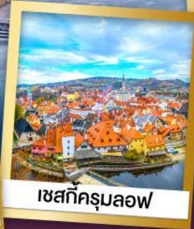
เซสกีครุมลอฟ