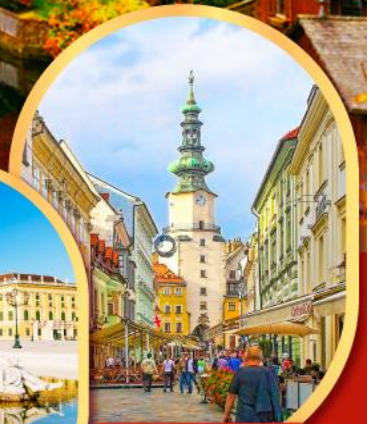
บราติสลาวา