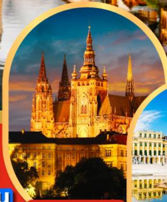
ปราสาทปราก