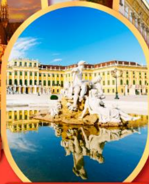
พระราชวังเซ็นบรุนน์