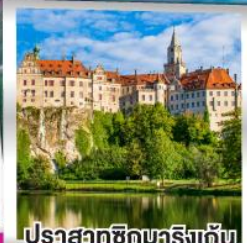
ปราสาทชิกมวริงเก้น