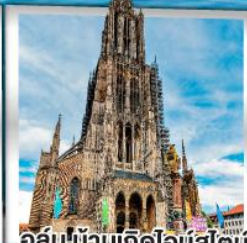
อูล์มบ้านเกิดไอน์สไตน์