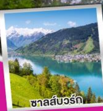
ชาลส์บวร์ค

การันตีพักค้างคืนบน ยอดเขาริเกิ ราชินีแห่งขุนเขาสวิตเซอร์แลนด์