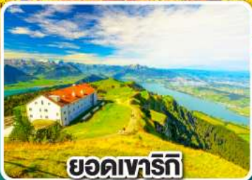
ยอดาเทาริก