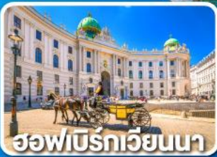
ฮอฟบิรกาเวียนนา